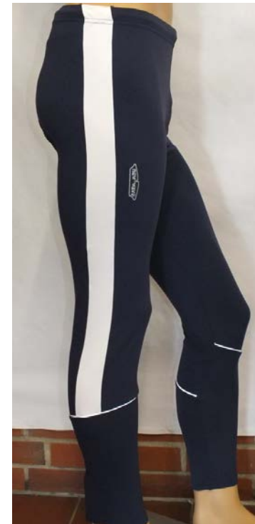
ARC Rhenus Clubbekleidung