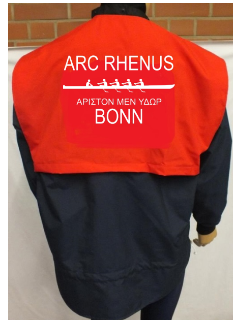
ARC Rhenus Clubbekleidung