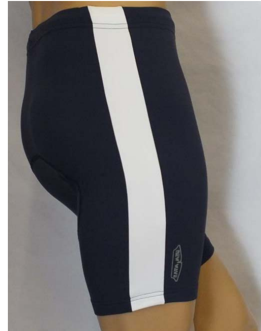
ARC Rhenus Clubbekleidung