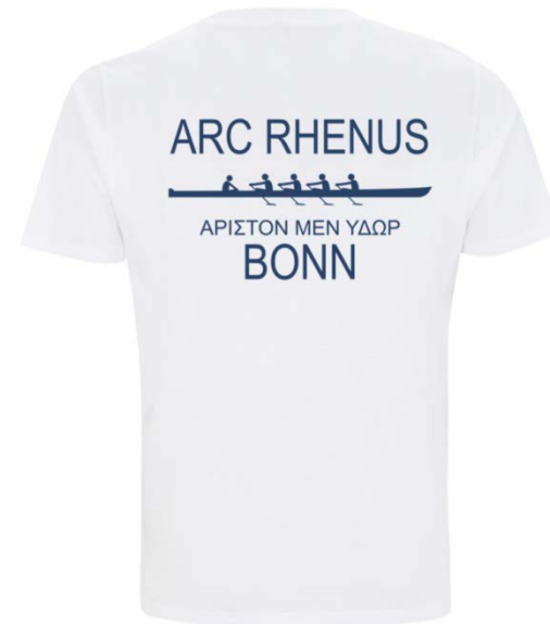
ARC Rhenus Clubbekleidung