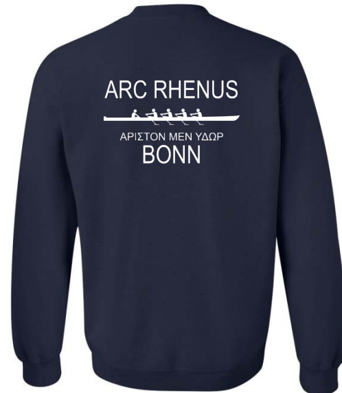
ARC Rhenus Clubbekleidung