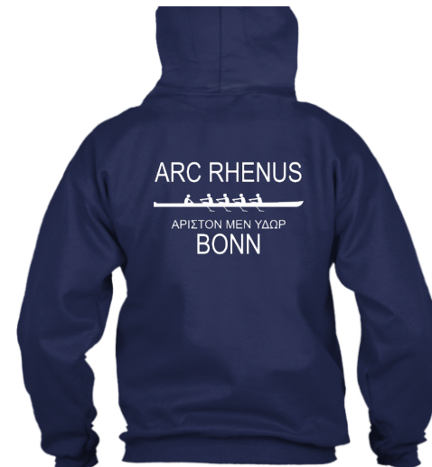
ARC Rhenus Clubbekleidung